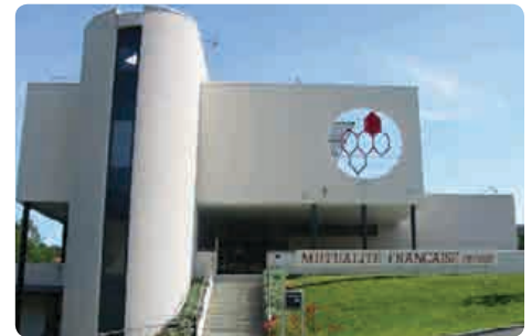
Mutualité Française Creuse 1 rue Charles Chareille - 23000 Guéret