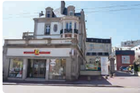
Mutualité Française Limousine 39 avenue Garibaldi - 87000 Limoges

Les services de soins et d'accompagnement mutualistes (Ssam)