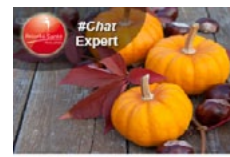
Rendez-vous de la nutrition Camille Grasset Mardi 20 octobre de 11h à 12h avec une diététicienne