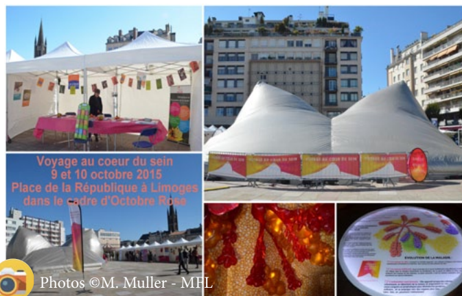
MFL «Voyage au coeur du sein» - Octobre Rose - Limoges