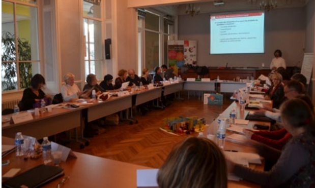
Formation sur la santé environnementale 03.12.15

La dernière formation de l'année 2015 portait sur une thématique d'actualité au moment de la COP 21 : la santé environnementale (formation annuelle proposée par le service prévention).